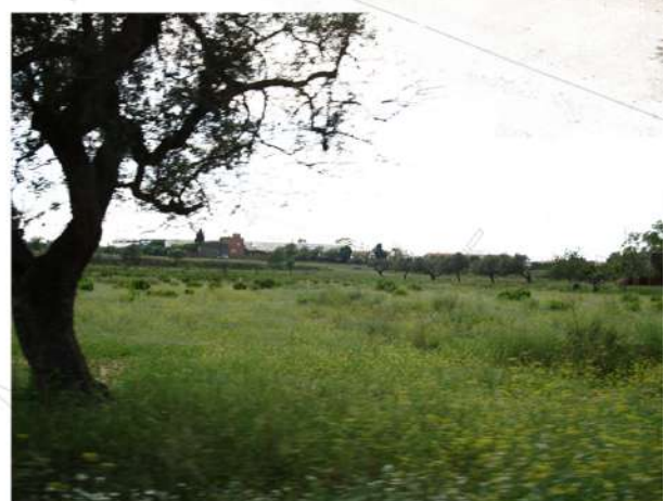
L'amplitud de les mirades defineix la magnitud dels espais sense construcció que caracteritzen la seva valorització com a espais oberts.