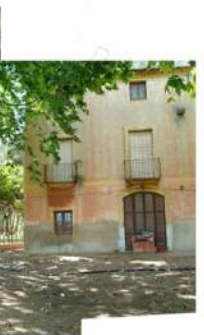
Mas Carreres. Per la seva ubicació i qualitats paisatgístiques seria idoni com a punt de referència de la "V" verda, imatge de la seva "marca" i centre d'activitats educatives dins de la perspectiva didàctica de la "V" verda.