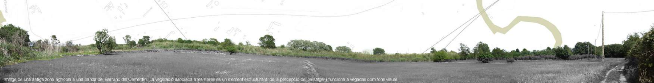
Imatge de una antiga zona agrícola a una banda del Barranc del Cementiri. La vegetació associada a les heres es un element estructurant de la percepció del paisatge i funciona a vegades com fons visual.