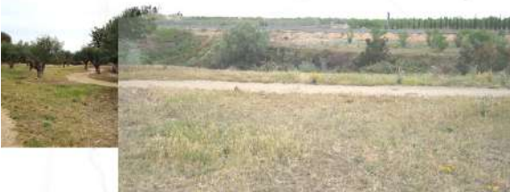
Àmbit del parc del Roquís