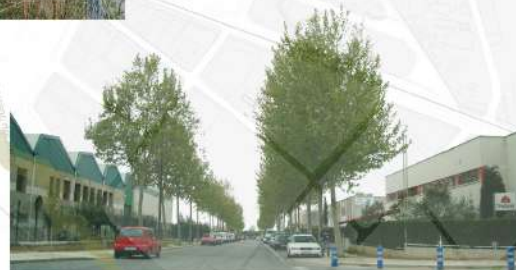
Polígon industrial del Roquís Utilització de la vegetació existent com a element de connexió transversal.