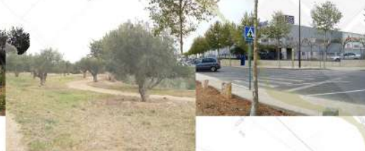
Utilització del patró agrícola en el projecte del parc del Roquís