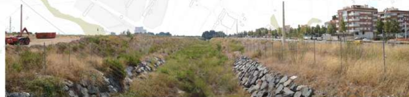
Carretera de Ruidoms: entrada de la "V" verda a Reus. Caldria un projecte de secció del carrer creant un carril bici i zones d'ombra mitjançant la plantació d'arbres.