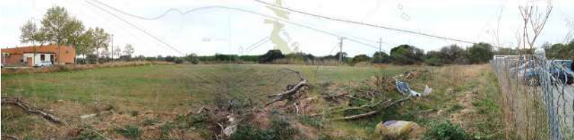
Àmbit rural i de confluència de rieres abans del polígon industrial del Roquís