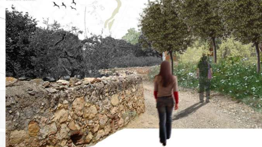
Millora paisatgística del barranc del Molí. Tractament dels talussos mitjançant l'ús de la vegetació. Es recomana la incorporació d'un estrat arbori que creï un apantallament del front construït.