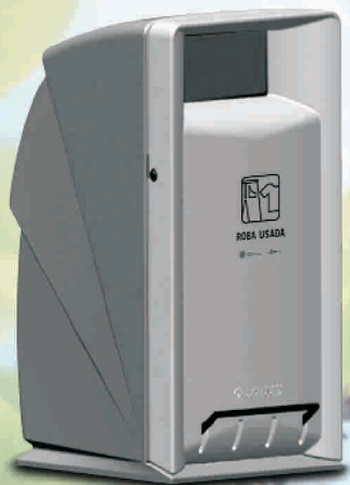
Roba usada (color gris)

L'Ajuntament de Reus aposta per la separació de residus, en aquest cas instal·lant en alguns centres de la ciutat contenidors per la recollida de roba usada i també d'olis vegetals domèstics embotellats.