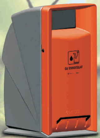
Olis embotellats (color taronja)

Adhesiu distintiu per al contenidor de roba usada