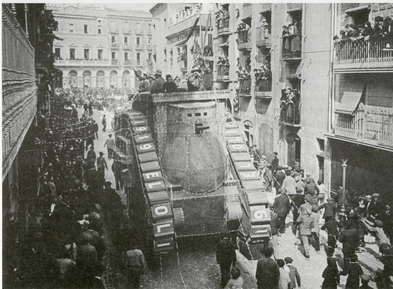
El tanc, carrossa de la societat L'Olimpo (1919).

En tot cas, abans com ara, la imatge constitueix una font documental cabdal per al coneixement dels esdeveniments socials. Cal, però, una lectura atenta que, més enllà de la simple il·lustració d'un text, ens permeti copsar tota la informació que ens aporten les velles fotografies.