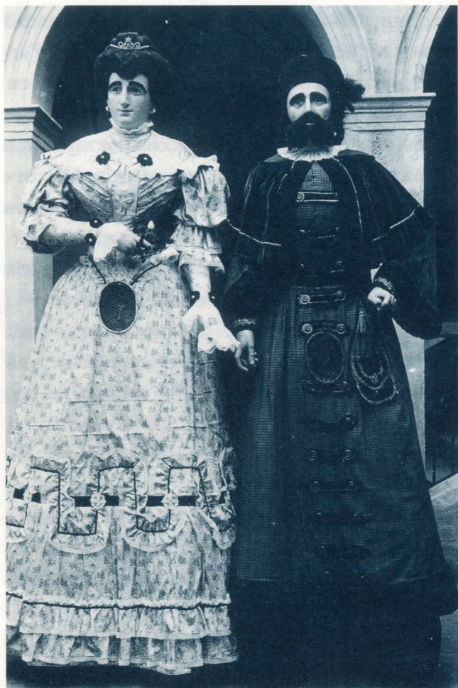
Els Vitxets o gegants petits de Reus, que probablement van ser guardats a la "presó."

pas en algun racó de la planta baixa. 10 Bofarull continua dient que: