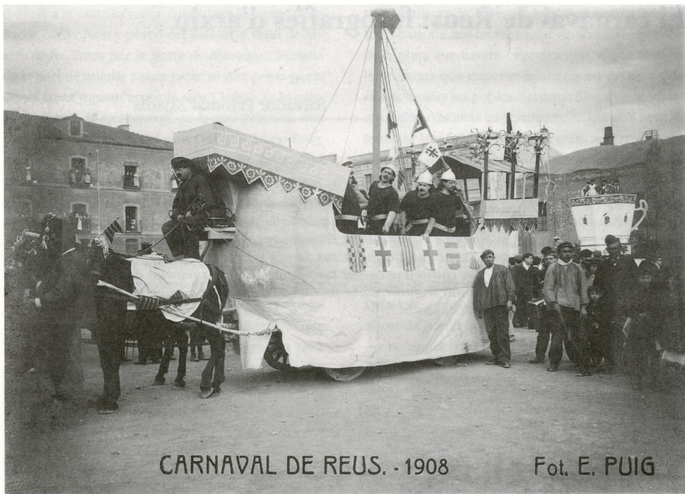
El galió, carrossa del Foment Republicà Nacionalista (1908).

segle xx, entre 1890 i 1920. Aquest és un període que ens ha deixat nombrosos testimonis gràfics, ja que correspon a un moment àlgid d'una celebració basada en l'existència d'un potent moviment associatiu a la ciutat i una important activitat comercial. Un carnaval burgès, en un sentit urbà i de classe, que s'havia iniciat amb el desenvolupament industrial, a mitjan segle XIX, i que perdurà fins a la prohibició de la festa per part del franquisme. Un carnaval que vol ser, alhora que divertiment, factor de promoció econòmica per a la ciutat. Una festa en què tothom hi pot participar, però on cada estament social hi apareix ben diferenciat.