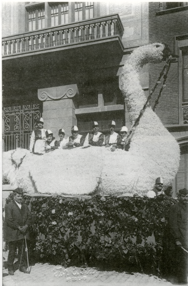
El cigne , carrossa de les famílies Gasull i Vilella (1916).

Amb tot, aquesta abundància d'imatges no ens ha de fer oblidar que aquestes ens mostren només una part de la festa. Els condicionaments