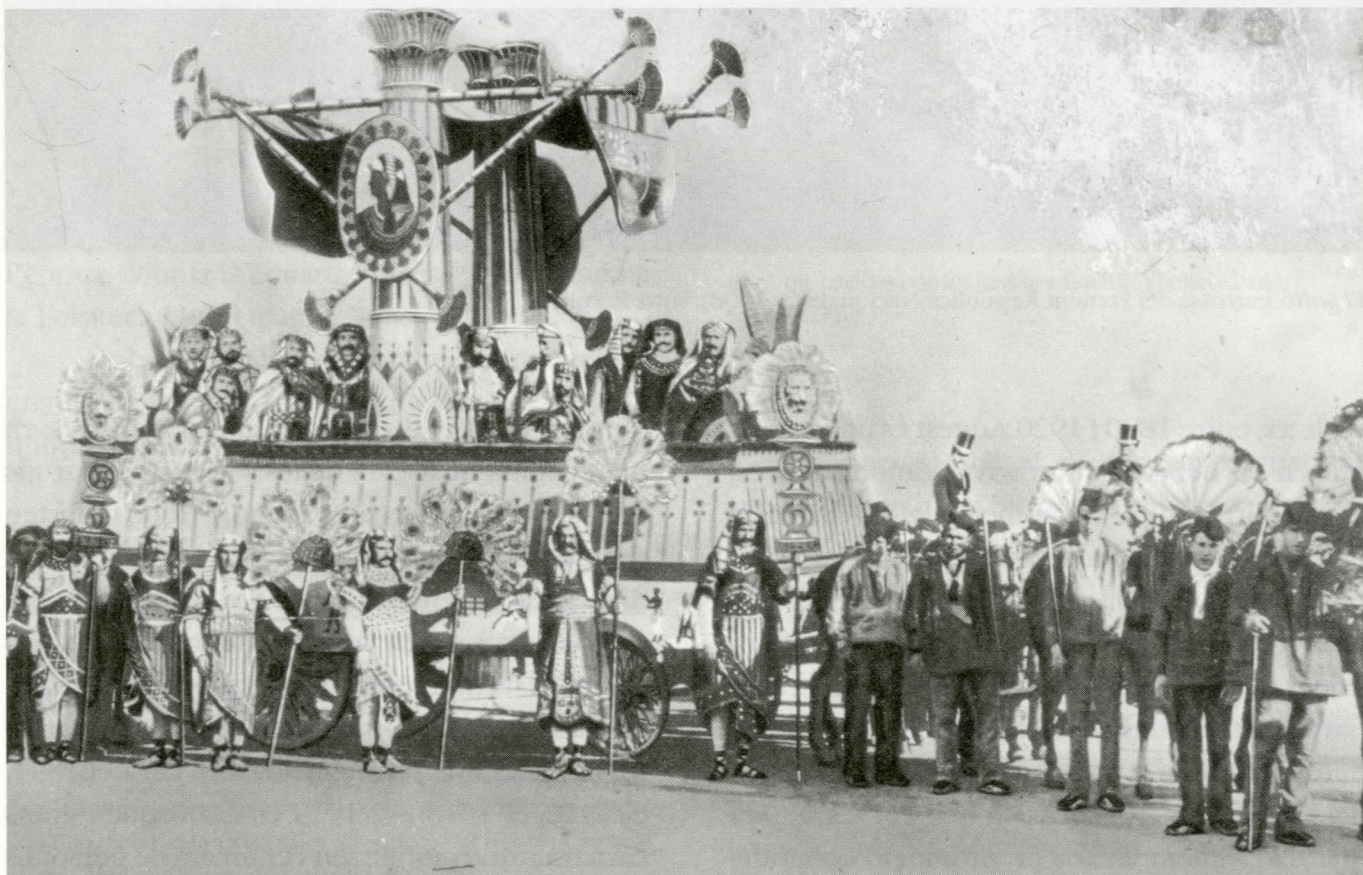
El carro egipci (1893). Autor desconegut

Aquest carnaval, l'Arxiu ha volgut col·laborar en l'ambientació de la festa amb l'organització d'una exposició de fotografies antigues del carnaval reusenc. La preparació de la