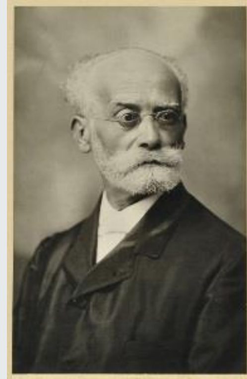
Felip Pedrell (1841-1922)