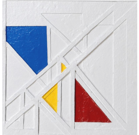
La imatge oficial del cartell és obra de.....