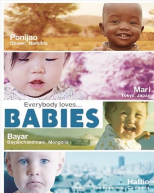
Caràtula de la pel·lícula

Inscripcions al telèfon 977 010 057 o bé a l'adreça electrònica maspintat@reus.cat