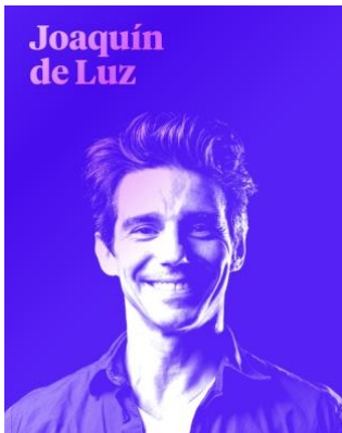
Joaquín de Luz