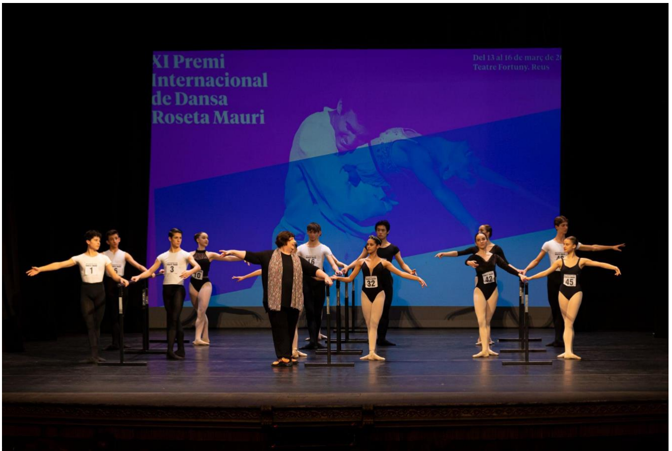
XI Premi Internacional de Dansa Roseta Mauri, març 2024

Concursants del IX Premi Internacional de Dansa Roseta Mauri, març 2019