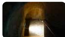
EL REFUGI ANTIAERI LA PATAcada Pl. de la Patacada, 12