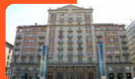
MUSEU DE REUS. LA LLIBERTAT. Plaça Llibertat, 13