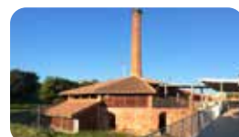
LA BÒBILA SUGRANYES Ctra. Tarragona, 6V