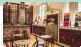
ESTACIÓ ENOLÒGICA. "CASA DEL VI I DEL VERMUT" Passeig Prim, 4-6

Reus és ple de cultura: endinsa't en una proposta diversa que combina història, art i experiències per a tots els públics. Descobreix la seva identitat a través d'espais singulars i viu la ciutat des de dins.