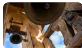
CAMPANAR DE L'ESGLÉSIA PRIORAL DE SANT PERE. Pl. Sant Pere, s/n