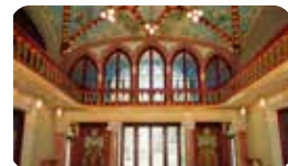
PAVELLÓ 6È DE L'INSTITUT PERE MATA Ctra de l'Institut Pere Mata, s/n