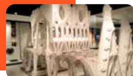
GAUDÍ CENTRE REUS Mercadal, 3

Reus és ple de cultura: endinsa't en una proposta diversa que combina història, art i experiències per a tots els públics. Descobreix la seva identitat a través d'espais singulars i viu la ciutat des de dins.