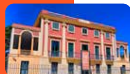
MUSEU DE REUS. EL CENTRE DE LA IMATGE MAS IGLESIAS Pl. de Ramon Amigó, 1