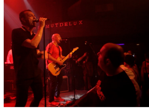
LOS GLOSTERS CATALUNYA, 2019. 60 MIN. VO.

TEATRE BARTRINA DIVENDRES 6 DE NOVEMBRE 17:30h