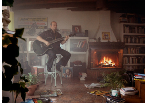
EL HOMBRE QUE PUDO SALVAR LA VIDA A MICHAEL JACKSON ESPANYA, 2020. 60MIN. VO.

Un viatge de descoberta i creixement personal que suposarà un punt d'inflexió. Els canvis s'acceleren quan en tornar, el país es troba sota l'ocupació japonesa, els rols i privilegis socials comencen a canviar i comença la lluita per la independència d'Indonèsia. Durant tot aquest temps, l'Alima mai deixa de dedicar-se al petit, tasca que conviurà amb la seva lleialtat a una nova causa i amant, un lluitador rebel a la colònia.