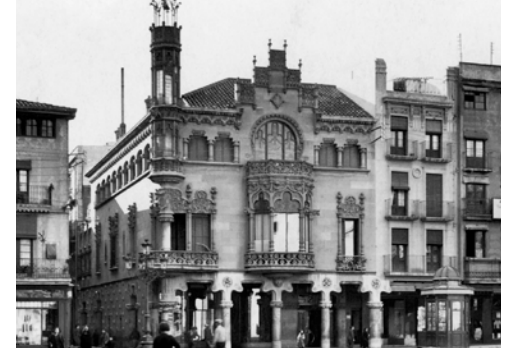
CASA NAVÀS. RECONSTRUÏT LA MEMÒRIA. CATALUNYA, 2019. 17MIN. VO.

Des dels seus inicis, cap a finals dels vuitanta amb el nom de Pirats, fins arribar a la formació actual, han passat moltes coses que els distingeixen com una de les formacions més enriquidores de l'escena mod. Per celebrar aquestes tres dècades d'existència, van oferir un aclamat concert a la sala tarragonina Zero el passat 2019. Rememorem el ja mític directe amb el testimoni dels seus principals protagonistes així com d'aquelles persones que han viscut d'una manera o altra l'ascens i la consolidació d'una banda incombustible.