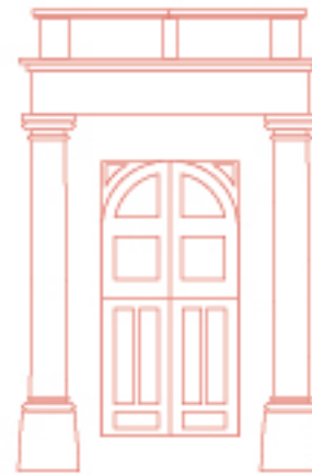
Ajuntament de Reus