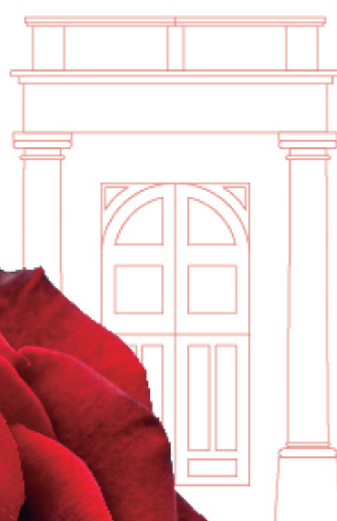
Ajuntament de Reus Plaça del Mercadal