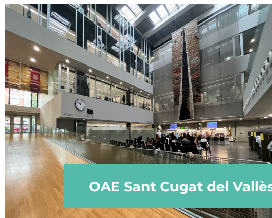
OAE Sant Cugat del Vallès