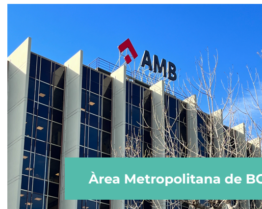
Àrea Metropolitana de BCN