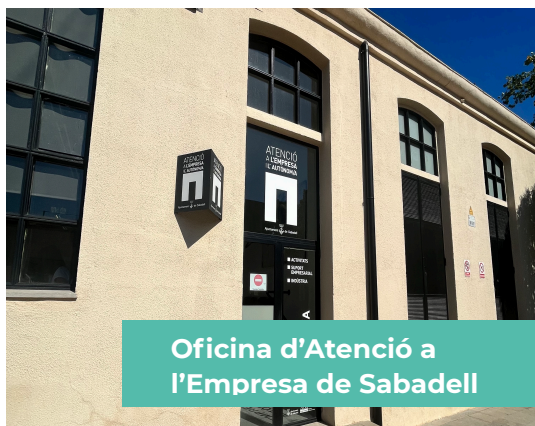
Oficina d'Atenció a l'Empresa de Sabadell