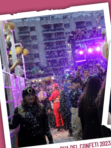
RUA DEL CONFETI 2023

A partir de les 9.00 h , a la plaça de Prim, EXPO-PROFIT ,