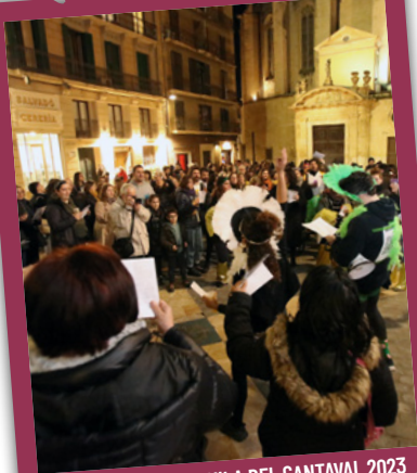
CERCAVILA DEL CANTAVAL 2023

A les 19.00 h , des de la plaça de les Peixateries Velles i pels