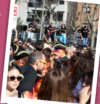
BALL VERMUT 2023

De 18.00 a 20.00 h , des de la plaça de la Llibertat, RUA DEL CONFETI , que passarà pel carrer del Doctor Robert, plaça de Catalunya, ravals del Pallol, de