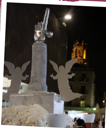
CERCAVILA DEL BRAÇ INCORRUPTE 2023

Del 6 al 17 de febrer, a la Sala d'Exposicions del Palau Bofarull, XVIII Mostra Fotogràfica del Carnaval de Reus «45 anys del Carnaval reusenc» .