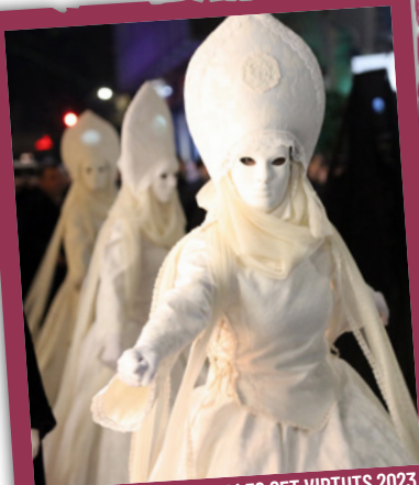
BALL DE LA QUARESMA I LES SET VIRTUTS 2023

A les 20.30 h , a la plaça de les Peixateries Velles, sota de la nova imatge de la Vella Quaresma d'enguany , interpretació íntegra del Ball de la Quaresma i les Set Virtuts . «La Quaresma són set setmanes: una coixa, cinc sanes i una santa.» Organitza: Germandat dels Set Pecats Capitals.