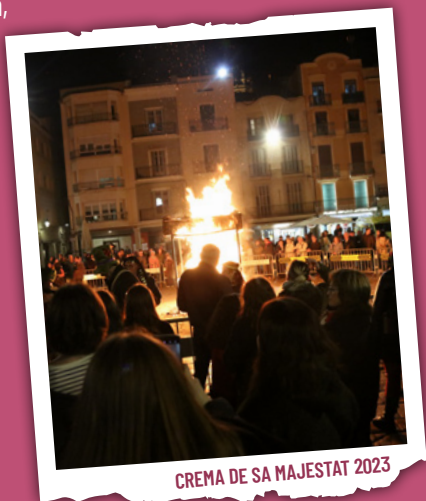
CREMA DE SA MAJESTAT 2023

A continuació , a la plaça del Mercadal, pública lectura del testament , i tot seguit, retirada de les cendres de Sa Majestat el Rei Carnestoltes LXIII. « D'oncles i ties, dol quinze dies; i, si no t'ha deixat res, un dia i no més. » Organitza: Germanat dels Set Pecats Capitals.