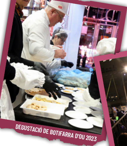
DEGUSTACIÓ DE BOTIFARRA D'OU 2023