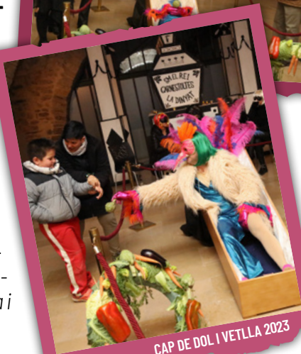
CAP DE DOL I VETLLA 2023