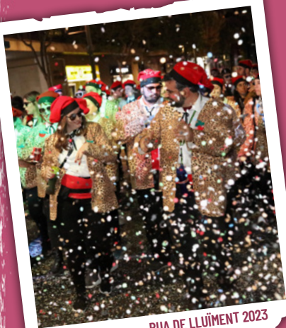
RUA DE LLUÏMENT 2023

De 18.00 a 21.00 h , al llarg de la plaça de la Pastoreta, passeigs de Prim i de Sunyer, plaça del Nen de les Oques, passeigs de Sunyer i de Prim i plaça de la Pastoreta, gran RUA DE LLUÏMENT , amb totes les colles participants i presidida pel Rei Carnestoltes i per la Reina. «A Carnestoltes, bones voltes.»