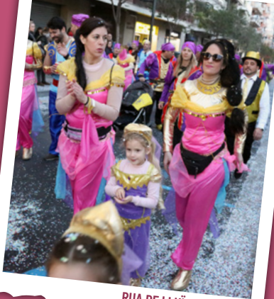
RUA DE LLUÏMENT 2023

De 17.00 a 18.00 h , a la plaça de la Pastoreta i al passeig de Prim, plantada de carrosses . «Per Carnestoltes, totes les bèsties van soltes.»