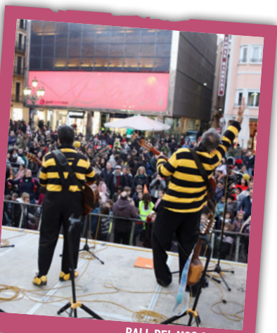
BALL DEL MOC 2023

De 19.00 a 22.00 h , a La Palma (c. Ample 75), JoveReusFest Carnaval , festa de disfresses per a joves nascuts el 2008, 2009 i 2010. Entrada: 3 € (inclou refresc i got). Condiició imprescindible: venir disfressat. Festa lliure d'alcohol i fum. Caldrà ensenyar el DNI a l'entrada. Inscripcions: joventut.reus.cat a partir del 26 de gener a les 16.00 h. Online a https://inscripcions.reus.cat/jovereusfestcarnaval o físicament a El Racó de La Palma, de dimecres a dissabte a partir de les 18.30 h. «Pa tou i vi vell fan tornar jove el vell.» Organitza: Casal de Joves La Palma i AMCA.