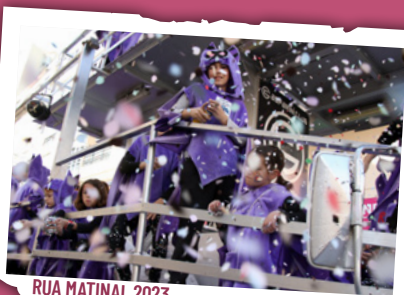
RUA MATINAL 2023

A les 11.45 h , des de la plaça de Pastoreta, RUA MATINAL ,