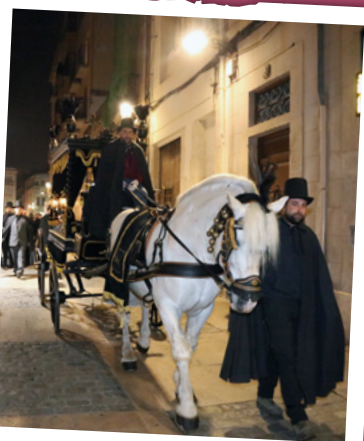
RUA MORTUÒRIA 2023

A les 19.00 h , des del Campanaret, Ball de la Quaresma i de les Set Virtuts , amb l'acompanyament musical del grup Staccato. « Abans d'ahir, ahir, avui, demà, demà passat, dissabte i diumenge. Quin dia és avui? » Organitza: Germanat dels Set Pecats Capitals.