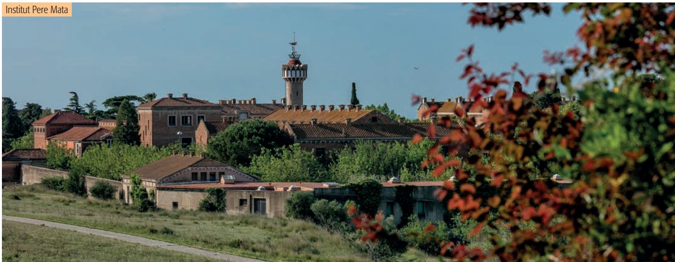
Institut Pere Mata