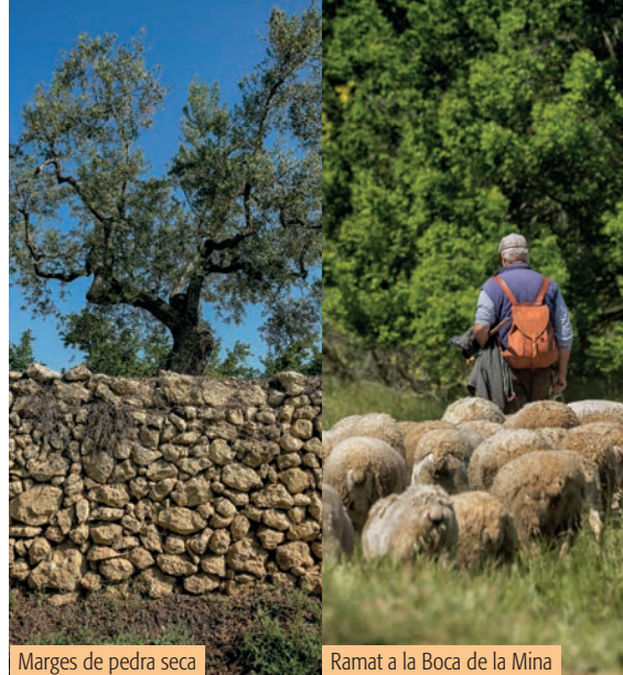
Marges de pedra seca

Bona part dels camins d'aquesta zona del terme estan ben delimitats per marges de pedra seca, un art constructiu mil·lenari que utilitza només la pedra sense cap material d'unió. Les pedres, procedents del despedregat dels camps, no només s'utilitzen per als marges, sinó també com a troncs per als arbres, per a fer séquies i rases per conduir l'aigua o per delimitar propietats. Així el despedregat tenia una doble funció: facilitar el treball dels camps i obtenir material per a la construcció dels marges i altres elements.