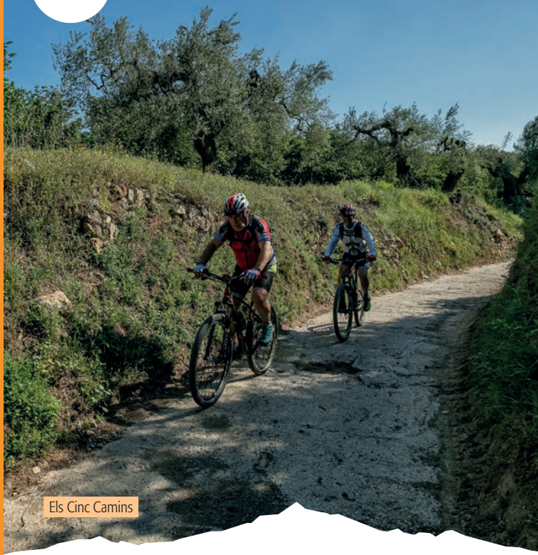
Els Cinc Camins